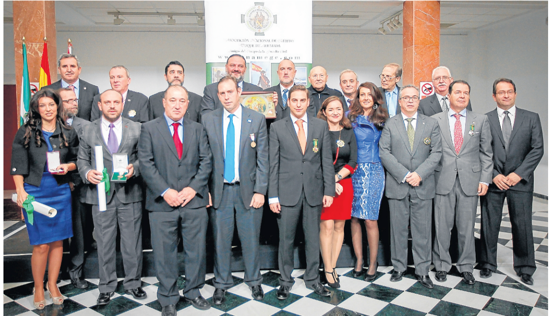
Todas las personas distinguidas por la asociación posan en la foto de familia.